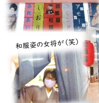
和服姿の女将が(笑)

10月13日～15日の3日間、2階のコーナーラウンジが居酒屋『松籟』に大変身!! 古き良き時代のセントラル横丁をイメージした街角が再現され、懐かしい雰囲気の中で、ビールやカクテル、ノンアルコールを美味しいおつまみで楽しめました。ご飯も用意させていただき、居酒屋ご飯を召上がった方も沢山いました。